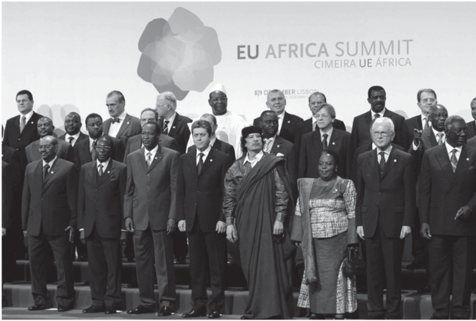
القادة الإفريقيون والأوروبيون في قمة الاتحاد الأوروبي- إفريقيا، لشبونة، ديسمبر 2007

الدول الأعضاء في الاتحاد الأوروبي مثل بريطانيا وفرنسا بمقاعد الدائمة في مجلس الأمن التابع للأمم المتحدة، هما بالفعل ممثلين دبلوماسيين بشأن قضايا أمنية دولية مثلما يقوم الاتحاد الأوروبي نفسه بعملية ، وفي عام 1999، استحدث الاتحاد الأوروبي منصب المسئول الأعلى لشئون السياسة الأمنية والخارجية المشتركة (والتي قامت حتى وقت كتابة هذا الكتاب بقيادة خافيير سولانا) كي يمثل مجلس الاتحاد الأوروبي لشئون السياسة الخارجية الخاصة بالاتحاد الأوروبي وكي يقوم بإجراء مفاوضات بالنيابة عن المجلس.