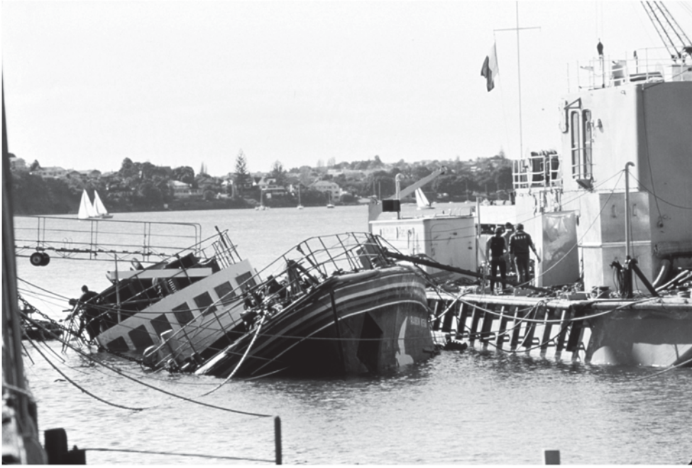
سفينة جماعة السلام الأخضر رينبو وارير الغارقة في خليج أوكلاند، نيوزيلاندا، أغسطس، 1985

الفرنسية بإغراق سفينة السلام الأخضر "رينبو وارير" عند رسوها في أوكلاند بنيوزيلاندا، وذلك لمنعها من التدخل لمنع التجارب النووية في جنوب المحيط الهادئ، ومن حيث الطريقة التي تنفذ بها منظمات المجتمع المدني الوظائف الدبلوماسية المحورية في التمثيل والاتصال فإنها تشبه في أوجه عدة أنواع المنظمات المشتغلة بالدبلوماسية والتي ذكرناها في الفصول السابقة مثل الحكومات والمنظمات متعددة الأطراف والشركات العالمية الكبرى.