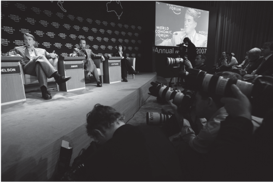
اجتماع منتدى الاقتصاد العالمي