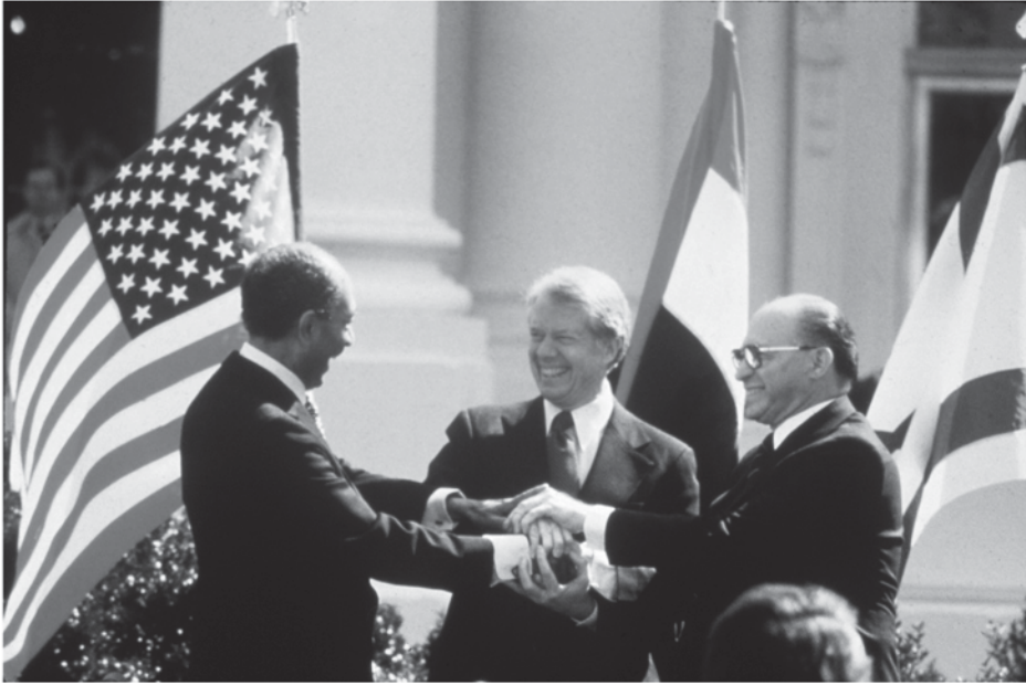
أنور السادات وجيمي كارتر ومناحم بيجين في البيت الأبيض لتوقيع معاهدة السلام بين مصر وإسرائيل، مارس 1979

مع التسليم بقدرة الاتصال على إحداث التغيير في الدول وممثليها الذين يقومون بالاتصال والتي أبرزتها الحالة المصرية الإسرائيلية فإن المرء يعتقد أن الاتصال باعتباره شكلاً حديثاً وواسعاً للتفاوض - يضم كل الأنشطة المحورية للدبلوماسية، وقد يثار تساؤل عن أشكال التمثيل والتي لا يمكن اعتبارها في حد ذاتها أفعالاً تواصلية، فعلى سبيل المثال أليس إرسال بعثة دبلوماسية دائمة لافتتاح سفارة في حد ذاته اتصالاً بالدولة المضيفة؟ وفي حين قد يبدو حقيقياً أن أي فعل من أفعال التمثيل يجسد مكوناً تواصلياً، فإنه ليس من المنطقي النزول بدراسة الدبلوماسية إلى مرتبة فرع من دراسة الاتصال أو نعتبرها مجرد مجموعة من الإشارات، ولأن دراسة الدبلوماسية تركز على كيفية تفاعل الدول مع بعضها البعض من خلال ممثليها، فإن الوظيفة الأساسية لكثير من الأنشطة الدبلوماسية هي في الأصل تمثيلية أكثر منها تواصلية في طبيعتها، فاختيار وزير للتجارة واختيار قائمة للطعام وخطة للجلوس في حفلة عشاء وتنظيم الواجبات