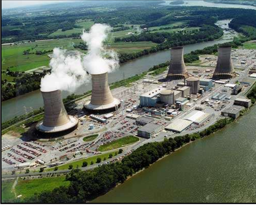
محطة طاقة نووية