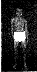
صورة لطفل مصاب بالشلل المعروف باسم (Ataxia)