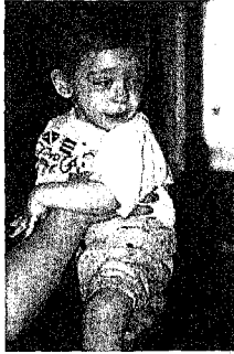
صورة لطفل مصاب بالشلل المعروف باسم (Athetosis)

هذه حالة من حالات شلل الأطفال، وهو النوع المعروف باسم Ataxia وتتميز بخلل واضح في المهارة الحركية، وعدم اتزان الجسم، والترنح أثناء المشي، بالإضافة إلى عدم الاستقرار في الحالة الانفعالية، وقصور في الناحية العقلية وعدم نضوج في القدرة على التعبير مصحوباً بالتواء معيب في النطق.