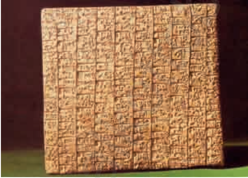
رقيم من إيبلا

يقع هذا القفر على مسافة ثلاثين ميلاً جنوبي حلب الجديدة، هناك بدأ ماتيه بشق هضبة عالية منتشرة على مسافة مئة وأربعين آرك، انتهت الأخيرة من أعمال ماتيه باكتشاف خمسة عشر ألف (رقيم) لوحة مسمارية وتبني هذه اللوحات عن تاريخ نهضة وسقوط إيبلا، ويعتقد أن المملكة القوية التي ازدهرت ما بين الفترتين (٢٤٠٠-٢٢٥٠) قبل الميلاد ليست مجرد براري كانت تقطن فيها قبائل البدو الرحل.