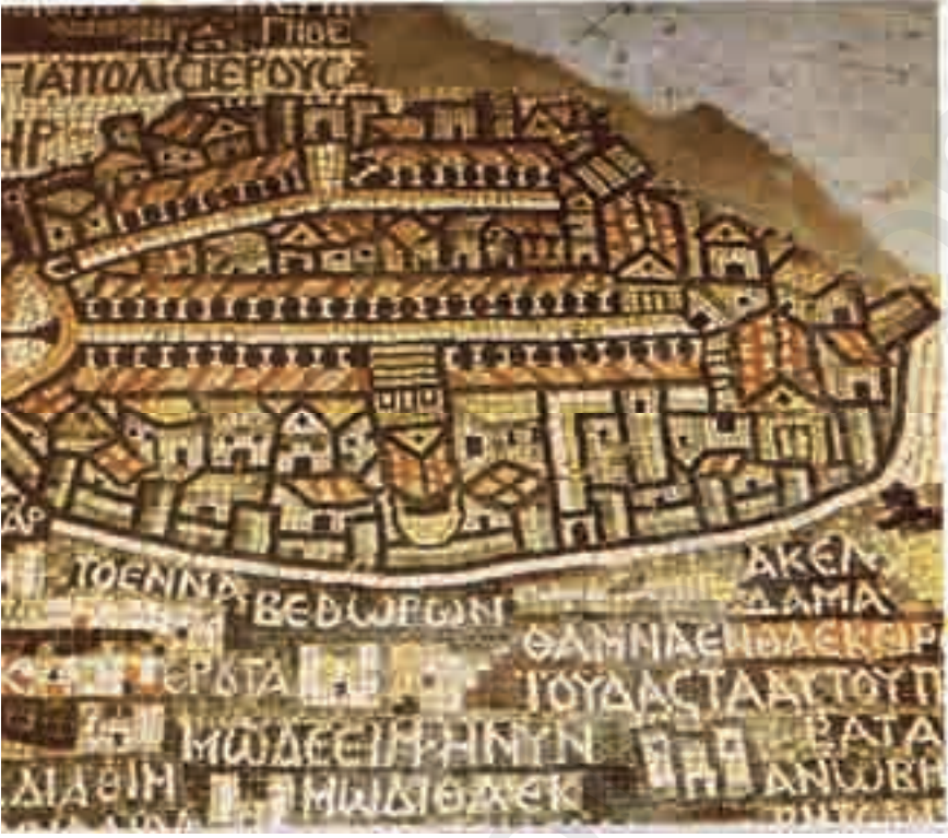
خارطة القدس - فسيفساء مأدبا - الأردن

لقد أوجدت نظرية «التوراة جاءت من الجزيرة العربية» لكمال صليبي (٦) مفترجاً لليأس التوراتي، فبعد أن أعلن علم الآثار عن عدم تطابق آثار هذه المنطقة مع التاريخ التوراتي، وعن عدم إثباته لأي من الأحداث التوراتية في هذه المنطقة. ظهرت هذه النظرية الجديدة لكي تنعش الآمال الصهيونية وتقدم لها فرصة عملية لم تكن تحلم بها.