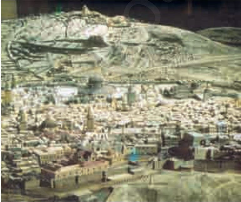
صورة القدس في العام ١٨٧٢ على لوح معدني

ويتحدث عن قوس روبنسون الذي ادعاه مازار، فنفى أن يكون هذا القوس قنطرة للعبور فوق الوادي باتجاه الهيكل. ولم يعثر فيما عدا هذا على أي أثر لمنشآت أقيمت في عهد هيرودوس. بل عثر في منطقة المدافن على كتابات آرامية لا تدل أبداً على علاقة بالعبريين، وهي تعود إلى عام ٤٠ م (٢٤).