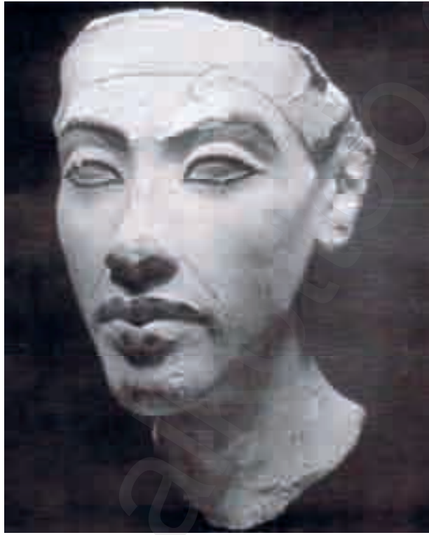
تمثال أخناتون (تحوتموس الرابع)

من أهم الوثائق عن اليبوسيين: رسائل تل العمارنة التي أرسلها السوريون إلى فرعون مصر أخناتون (١٣٦٧-١٣٥٠ ق.م). وفيها ذكر العبادة السائدة في أور سلام وأسماء الملوك، و منهم عبد هيبا وعلاقته بمصر في عهد أخناتون. ويتحدث التوراة عن علاقة النبي إبراهيم عام ١٩٠٠ ق م مع ملكي صادق. وذكر اسم أدوني صادق في عهد موسى.