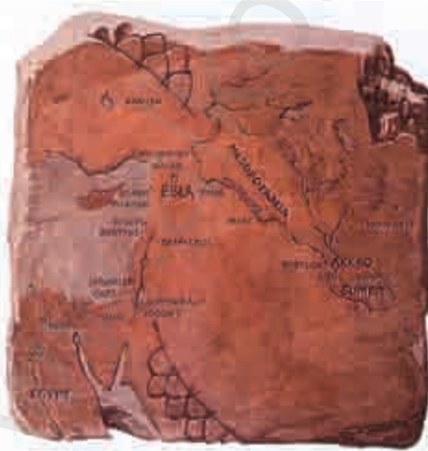
اللوحة المكتشفة في إيبلا، عليها مخطوطة التوراة القديمة وعليها مخطوطة إيبلا.

يعد اكتشاف إيبلا الذي تم في الآونة الأخيرة مع آلاف اللوحات الكائنة في أرشيف قصرها بأنه من أعظم الاكتشافات الأثرية في هذا العصر. وتلقي الأبحاث الدائرة هناك ضوءاً على الصفة الإنسانية لأقدم المدن الكبيرة التي عرفتها البشرية، على أن الجدل الحالي لا ينبثق من تلك المسائل العلمانية بل من الصلات الدينية والعرقية التي قامت بين شعوب إيبلا وفلسطين. وتوحي التقارير الأولية بأن اللوحات تشتمل على إشارات عديدة تربط إيبلا بعالم التوراة (ر: ٣١).