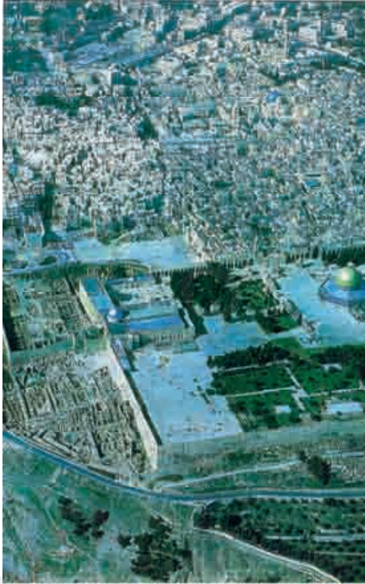
اكتشاف قصور أموية

وقد سميت دار السلام (أورسلام) باللغة الكنعانية القديمة، وعثر على هذه التسمية في النصوص الكنعانية التي عثر عليها في مصر، كما عثر عليها في النصوص العمورية في سورية (٢٧).