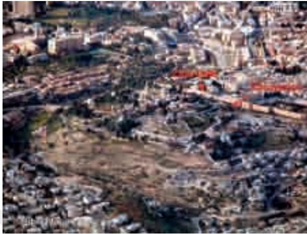
مواقع التنقيب حول الحرم

مشهد آخر الحفريات التي أجراها الإسرائيليون في القدس حال ضغط الأفكار التوراتية وغزارة المنشآت التاريخية في القدس القديمة دون التنقيب بحثاً عن الآثار الأولى في أور سلام ونسقريء ازدهار هذه المدينة من قوائم تحوتموس الثالث والد أخناتون، الذي نهب المدن الأكادية ومنها القدس.