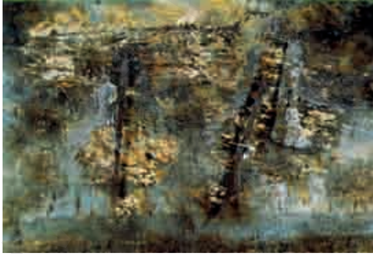
آثار اليوسيين في القدس

أورشليم هي أور= مدينة، وشليم = سلام، ويذكر التوراة أن هذا الاسم طارئ على اليهود. واسم القدس القديم هو ييوس نسبة لليوسيين العرب الذين نزحوا إليها مع منتصف الألف الثالث قبل الميلاد أي قبل قرون من ظهور إبراهيم وموسى وداود.