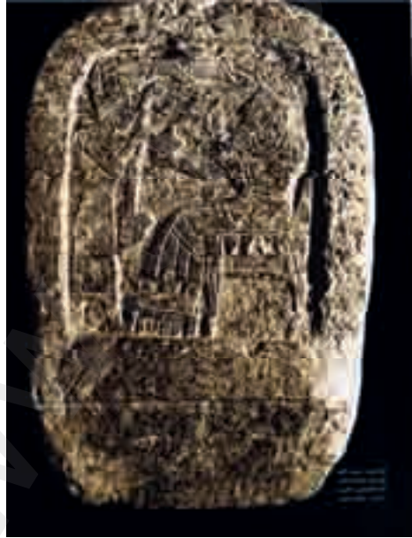
لوح يمثل عبادة إيل

وتبين أن اللغة العربية قادرة بمفرداتها وبنائها اللغوي أن تكون مرجعاً لوحدة هذه اللغات السابقة للغة العربية، وليست اللغة العبرية التي وضعها الحاخام بن يهودا، كما ورد في كتاب (العرب في فلسطين).