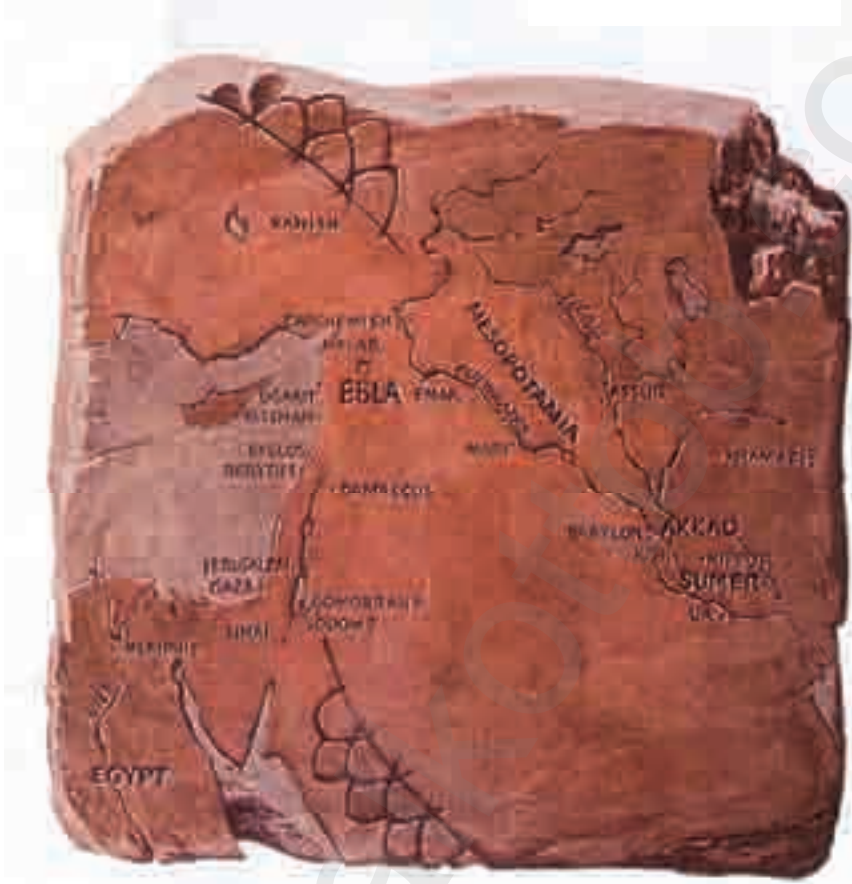
رقيم حديث مثلث عليه خارطة سورية القديمة وعليها موقع ايبلا.

وثائق إيبلا لها دور هام في توضيح تاريخ أور سلام القديم، من خلال الأسماء التي وردت في هذه الوثائق التي شكلت مكتبة ضخمة من الرُّقُم.