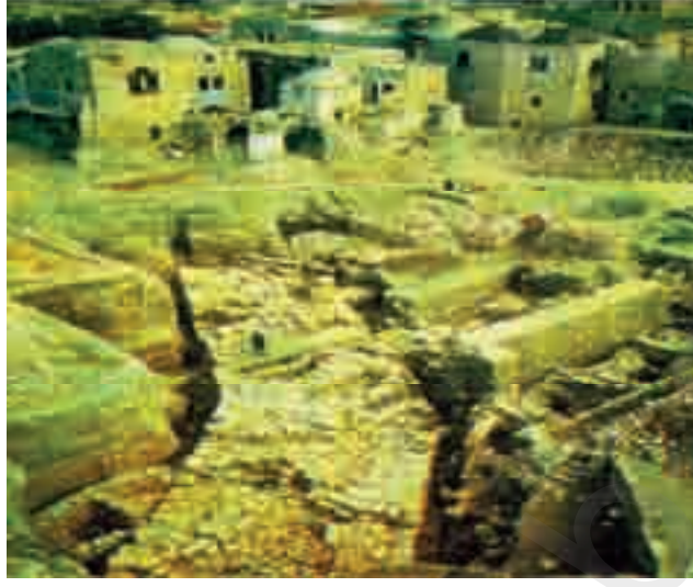
من حضريات القدس

استمر هاجس البحث عن الهيكل يشغل وزارة الأديان ومصلحة الآثار في إسرائيل، لتأكيد وجودهم تاريخياً في القدس، وكثيراً ما حاول الإسرائيليون التنقيب تحت الحرم الشريف مما يؤثر على بناء المسجد الأقصى وقبة الصخرة والأبنية الإسلامية الأخرى في الحرم الشريف. ولم تستطع أعمال التنديد وقرارات الشجب والمنع التي وجهتها منظمة الأمم المتحدة، أن توقف أعمال البحث عن الهيكل في منطقة الحرم.