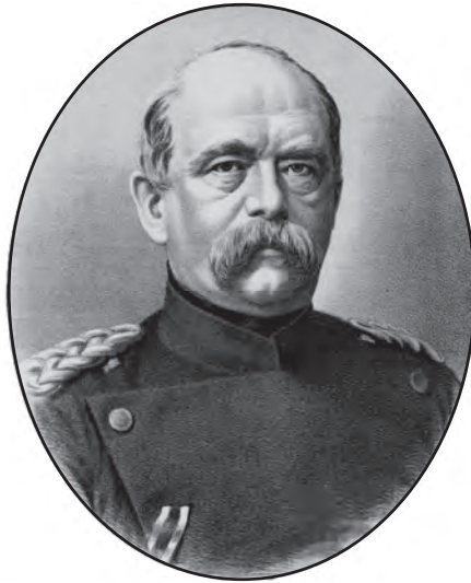
شكل ٣-٢: الأمير أوتو فون بسمارك. 2

عندما أسس المستشار الألماني أوتو فون بسمارك الرايخ الألماني عام ١٨٧١، أتى هذا بالدرجة الأولى على حساب فرنسا في حرب التوحيد الثالثة. تعرضت فرنسا لإذلال وحشي؛ فقد وقع الإمبراطور الفرنسي في الأسر ثم نُفي إلى الخارج، ووقعت البلاد تحت احتلال جزئي، وتعيّن عليها دفع تعويضات حرب جسيمة، وخسرت إحدى مقاطعاتها الهامة؛ وهي منطقة الألزاس واللورين التي أصبحت تُدعى «المقاطعة الإمبراطورية» إلى أن استعادتها فرنسا بعد الحرب العالمية الأولى. وكان من شأن هذا الخزي الذي تعرضت