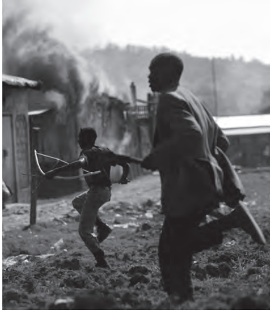
شكل ٦-٣: الاضطرابات المدنية في أفريقيا: رجلان من قبيلة «كيسي» يجران في حقل بينما يحاربان مجموعة من سكان قبيلة «كالينجين» في بلدة شيبيلات غربي غينيا في الثالث من فبراير عام ٢٠٠٨. 3

وهي أكبر منظمات الأمن الأوروبي، من حيث إنها تتضمن روسيا بوصفها خليفة للاتحاد السوفييتي. وبالإشتراك مع منظمة حلف شمال الأطلسي (الناتو)، التي تتضمن الولايات المتحدة الأمريكية، تطورت مهمة منظمة الأمن والتعاون في أوروبا لتتحول من وسيط للحوار في مجال تحقيق الأمن البشري ومنظمة داعمة للديمقراطية إلى العمل في مجال حفظ السلام. وترى الباحثة السياسية نينا جرايجر والخبيرة في مجال الأمن والسلام أليكساندرا نوفوسلوف أنها «المنظمة الأهم في إرساء المعايير في أوروبا». رغم أن فاعليتها هذه يقوّضها التنافس الاستراتيجي المتجدد بين الولايات المتحدة الأمريكية وروسيا. باختصار، تُعزّز العولمة من كفاءة الروابط بين الدول المتعددة، غير أنها تجعل المجتمعات القومية عُرضة لمجموعة أكبر من الصدمات الدولية والمخاطر الأمنية. وعلى