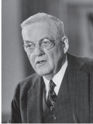
شكل ٥-٢: جون فوستر دولز. 2

الهادي، فما كان من دولز إلا أن صرح بأن مخاوف سبيندر من اليابان مغالً فيها؛ فكان جواب سبيندر هو أن أوجه اعتراض دولز على إبرام المعاهدة مجرد أوهام، ورغم هذا اتفق دولز مع سبيندر على وجوب التوصل إلى تسوية.