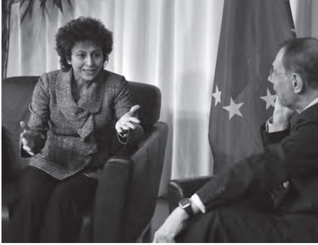
شكل ٦-٢: دبلوماسية المجتمع المدني: إيرين خان، الأمين العام لمنظمة العفو الدولية (إلى اليسار)، وخافيير سولانا الممثل الأعلى للسياسة الخارجية للاتحاد الأوروبي (إلى اليمين)، خلال اجتماع لهما في الخامس عشر من أبريل عام ٢٠٠٨. 2

في أوروبا وأفريقيا. فأرسل الاتحاد الأوروبي عام ٢٠٠٣ قوات حفظ سلام إلى جمهورية مقدونيا (جمهورية مقدونيا اليوغوسلافية السابقة)؛ لإرساء الاستقرار في هذه الدولة بعد حرب أهلية قصيرة اندلعت بها عام ٢٠٠١. ومما يدل على عزم الاتحاد الأوروبي على لعب دور أكثر فاعلية في تحقيق الأمن على المستوى الإقليمي، يحتفظ الاتحاد الأوروبي اليوم بقوات «الاستجابة السريعة» متعددة الجنسيات، والتي يبلغ قوامها ١٥٠٠ جندي؛ لمواجهة الأزمات الاستراتيجية والإنسانية، ليس في أوروبا وحسب، بل أيضاً في شمال أفريقيا وجنوب الصحراء الكبرى.