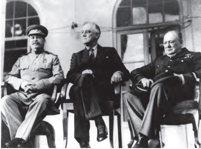
شكل ٤-١: قادة الدول الثلاث الكبرى في اجتماع طهران عام ١٩٤٣: تشيرشل وستالين وفرانكلين دي روزفلت. 1

مباشراً يهدّد بتقويض جهودنا الحربية المشتركة. لقد توصلنا إلى خطة عمل جيدة جداً فيما يتعلق بكل هذه البلدان، كلٌّ على حدة، ومجموعة معاً؛ وذلك بهدف تركيز كل جهودها وتنسيقها لتتوافق مع جهودنا في مواجهة العدو المشترك والتأسيس — قدر الإمكان — لتسوية سلمية.