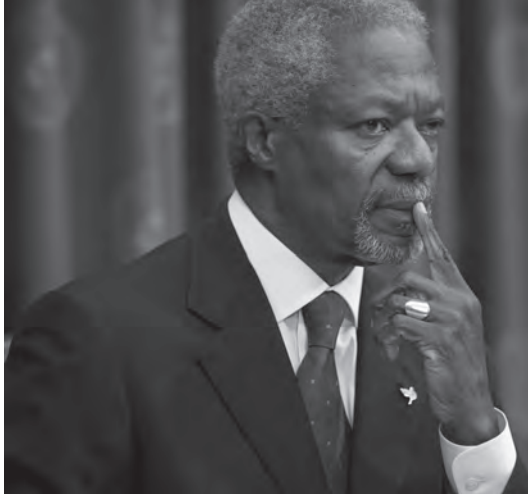
شكل ٦-١: كوفي أنان. ١

الموارد البشرية والطبيعية على نحو أكثر فعالية؛ لأن المرأة تميل إلى ضمان المساواة في تقسيم الموارد المقدّمة إلى المجتمع، والتأكد من الاستفادة من دروس التنمية ونقلها إلى الأجيال القادمة، إلا أن مؤيدي المساواة بين الجنسين يواجهون معارضة قوية في المجتمعات التي تُحرّم فيها المرأة من الالتحاق بمستويات التعليم العليا ومن العمل؛ إذ تُستغلّ «القيم التقليدية» في العديد من أنحاء العالم لتبرير إقصاء المرأة. وليس الأمر مسألة صراع بين المحافظة الدينية والحدّات العلمانية؛ ففي العديد من الدول الإسلامية الحديثة، ومن بينها ماليزيا على سبيل المثال، تُشكّل الفتيات غالبية الطلاب في مرحلة التعليم بعد الثانوي. فالأمر يتعلق بالأحرى بالتقاليد الراسخة والهيمنة الذكورية والتخلف الاقتصادي؛ وهي عوامل تتعلق بالأنظمة ككل، وقد يستغرق هدمها عدة عقود. يرى البروفيسور رولاند باريس أن مفهوم الأمم المتحدة الواسع للأمن البشري بنطاقه الشامل من القضايا التي تضمّنّها يحمل مخاطرة؛ وهي أنه ربما يشكل عبئاً ثقيلاً يمنعه من أن يكون تعريفاً قابلاً للتطبيق. في التقرير الذي أصدره المركز الكندي للأمن البشري بجامعة كولومبيا البريطانية عام ٢٠٠٦، عمل الباحثون على تضيق