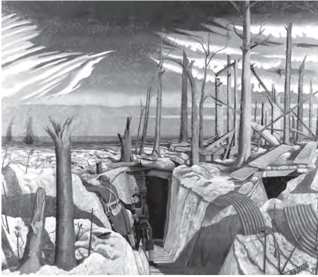
شكل ٣-١: حرب الخنادق: الاستيلاء على الغابة الواقعة غرب بلدية أوبي (١٩١٧)، بريشة الفنان جون ناش. 1

الجيش؛ مما كان يعني بالأساس أن يتولى الملك مسئولية وضع السياسات كافة، وأنه إذا رأى أن خوض حرب ما يشكل ضرورة لأسباب تتعلق بالدولة، فإنه يفوض الجيش للتخطيط للحرب وخوض غمارها. وبهذه الطريقة، كان من المفهوم إمكانية تأمين الحماية القصوى للبلاد. وقد لعبت أسرة هوهنتسولرن على جميع المستويات المهمة دورًا مؤثرًا في تشكيل الثقافة السياسية البروسية الألمانية التي امتدت حتى نهاية الحرب العالمية الثانية.