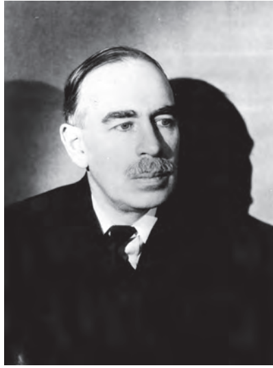
شكل ٣-٤: جون ماينارد كينز. 4

وكان مما أثار قلق كينز أيضًا، أن بريطانيا لم يسبق لها من قَبْل أن فرضت تعويضات واسعة المدى كهذه؛ إذ وفقًا للاتفاقية، حُوِّل للجنة التعويضات الحصول على خمسة مليارات دولار أمريكي من ألمانيا في أي صورة (نقود سائلة، أملاك، مواد خام) بحلول مايو من عام ١٩٢١. وكما قال كينز معترضًا «فإن هذا الشرط أوكل إلى لجنة التعويضات سلطات ديكتاتورية للفترة سالفة الذكر تتحكم بها في جميع أملاك ألمانيا بأي صورة كانت.» لكن تبين أن هذا ليس إلا أول فاتورة تدفعها ألمانيا من قائمة ديون ضخمة وغير واقعية تدين بها لقوات الحلفاء، كما توقَّع كينز أن تشهد ألمانيا فترة كساد اقتصادي كبير نتيجة للمعاهدة، يفقد على أثرها الكثيرون وظائفهم، ويهلك بسببها الكثيرون بما سببته خطط قوات الحلفاء للسلام من تضيق للخناق على اقتصاد جمهورية فايمار. بدا بالفعل لكينز أن صانعي السلام قد سعوا عامدين إلى تدمير ألمانيا، فيقول: «البنود الاقتصادية بالمعاهدة شاملة، ولم يُغض الطرف بها عن أي شيء قد يتسبب في إفقار ألمانيا في وقتنا الراهن أو يعرقل تقدمها في المستقبل.» وفي النهاية نوّه