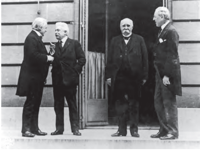
شكل ٣-٣: قادة الدول الأربع الكبرى في فرساي: وودرو ويلسون، ولويد جورج، وجورج كليمنصو، وفيتوريو أورلاندو رئيس وزراء إيطاليا. 3

وكان هذا يعني أن الشعب الألماني تحمّل وحده — ووحده تمامًا — المسؤولية عن الحرب الأكثر دمارًا في التاريخ، رغم الأسباب المختلفة التي أدّت إلى نشوب الحرب، ورغم تبرؤ الشعب الألماني من القيصر وتأسيس ديمقراطية برلمانية.