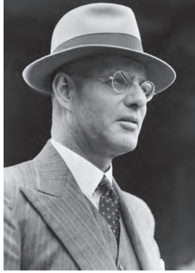
شكل ١-٥: جون كيرتن. 1