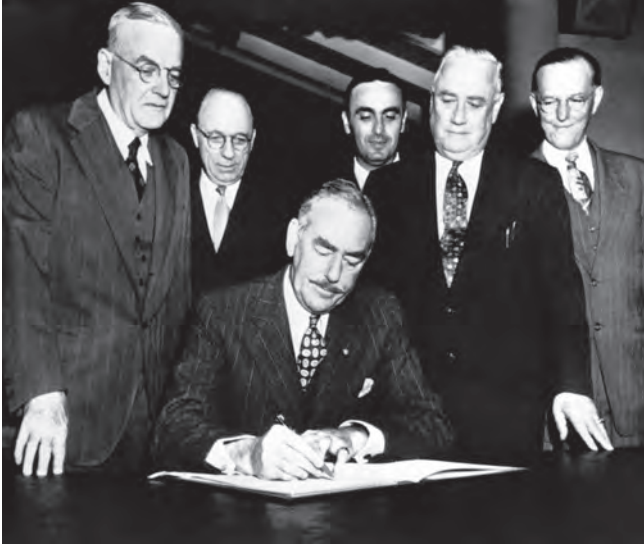
شكل ٥-٣: توقيع معاهدة أنزوس في سان فرانسيسكو عام ١٩٥١. 3