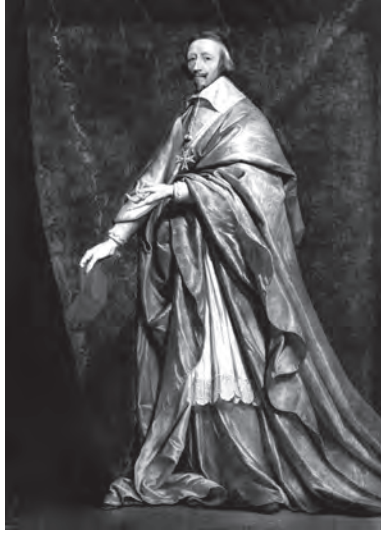
شكل ١-١: الكاردينال ريشيليو. 1

إلا مفوضيات لها بالعاصمة الأمريكية. لكن عام ١٨٩٣، أجاز الكونجرس الأمريكي ترقية العديد من المفوضيات الأمريكية المهمة إلى سفارات شريطة أن تتخذ الدول الأخرى الخطوة نفسها. ومنذ ذلك الحين، أخذت السفارات تدريجياً تحل محل المفوضيات حتى عام ١٩٦٦، الذي شهد تحوُّل آخر مفوضيتين أمريكيتين (في بلغاريا والمجر) إلى سفارات؛ الأمر الذي دلَّ على الأهمية المتزايدة التي أولتها الولايات المتحدة الأمريكية لسياساتها الدبلوماسية.